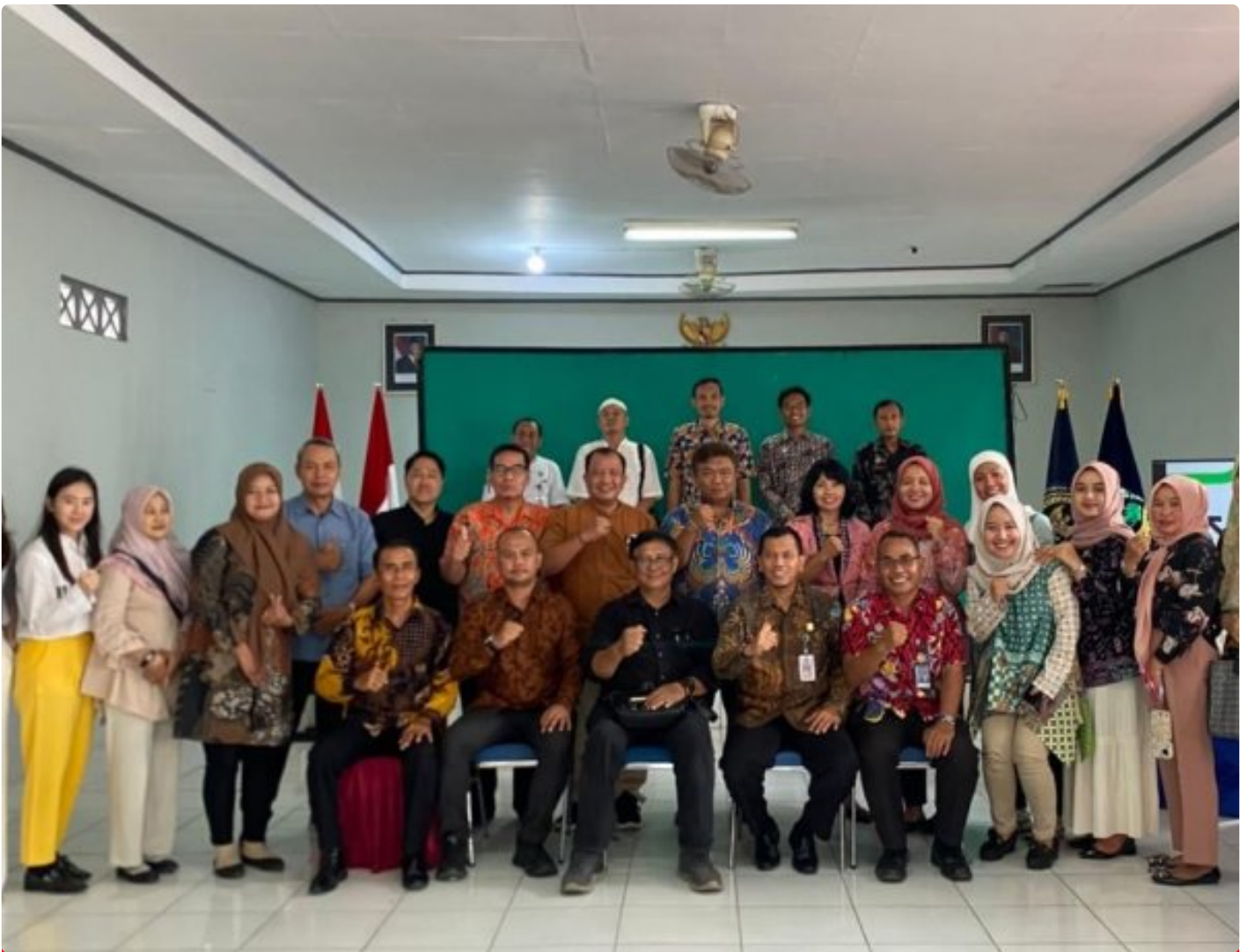
Audit Kepatuhan Notaris Digelar di Lapas Kelas IIA Pekalongan

Pekalongan – Lembaga Pemasyarakatan Kelas IIA Pekalongan menjadi lokasi pelaksanaan Audit Kepatuhan Notaris yang diselenggarakan oleh Kementerian Hukum Kantor Wilayah Jawa Tengah, Jumat (14/11/2025).