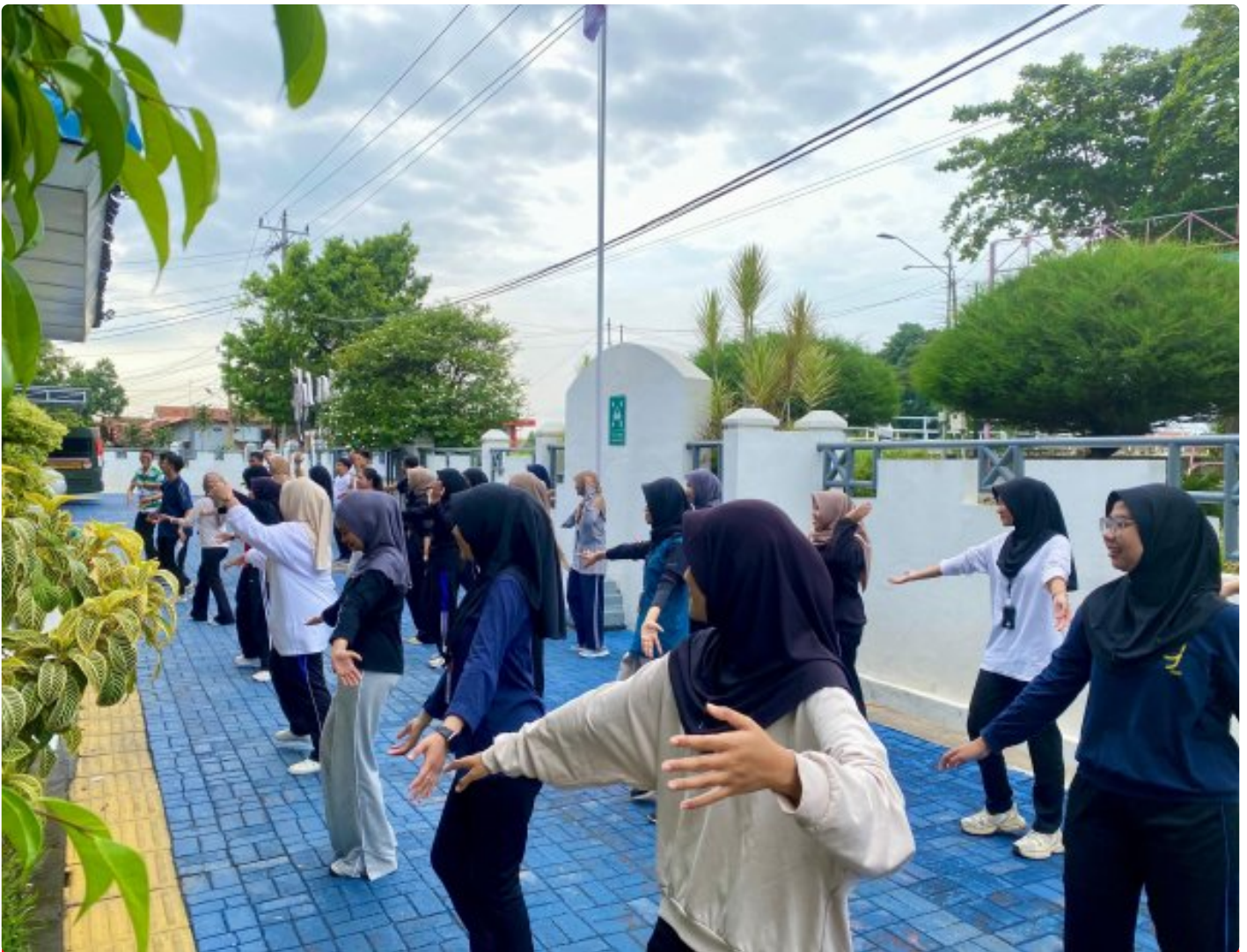
Jaga Kebugaran, Peserta Maganghub Rutan Pekalongan Senam Bersama

Pekalongan - Dalam rangka menjaga kebugaran fisik, seluruh peserta Maganghub Rumah Tahanan Negara Kelas IIA Pekalongan mengikuti kegiatan senam pagi bersama yang dilaksanakan di halaman Rutan, Sabtu (13/12/25).