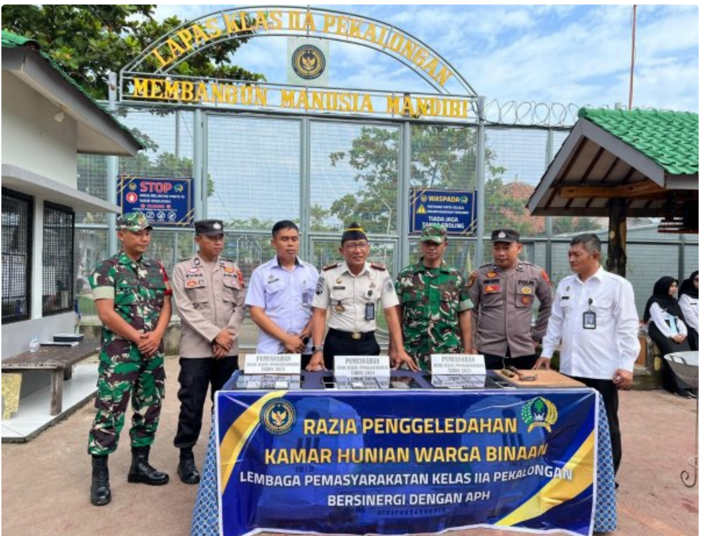
Jaga Kondusivitas Nataru, Lapas Pekalongan Laksanakan Apel Siaga dan Penggeledahan Kamar Hunian

Kota Pekalongan – Dalam rangka menjaga stabilitas keamanan dan ketertiban menjelang perayaan Natal 2025 dan Tahun Baru 2026, Lembaga Pemasyarakatan (Lapas) Kelas IIA Pekalongan melaksanakan Apel Siaga serta razia blok hunian bersama Aparat Penegak Hukum (APH), Senin (29/12/2025).