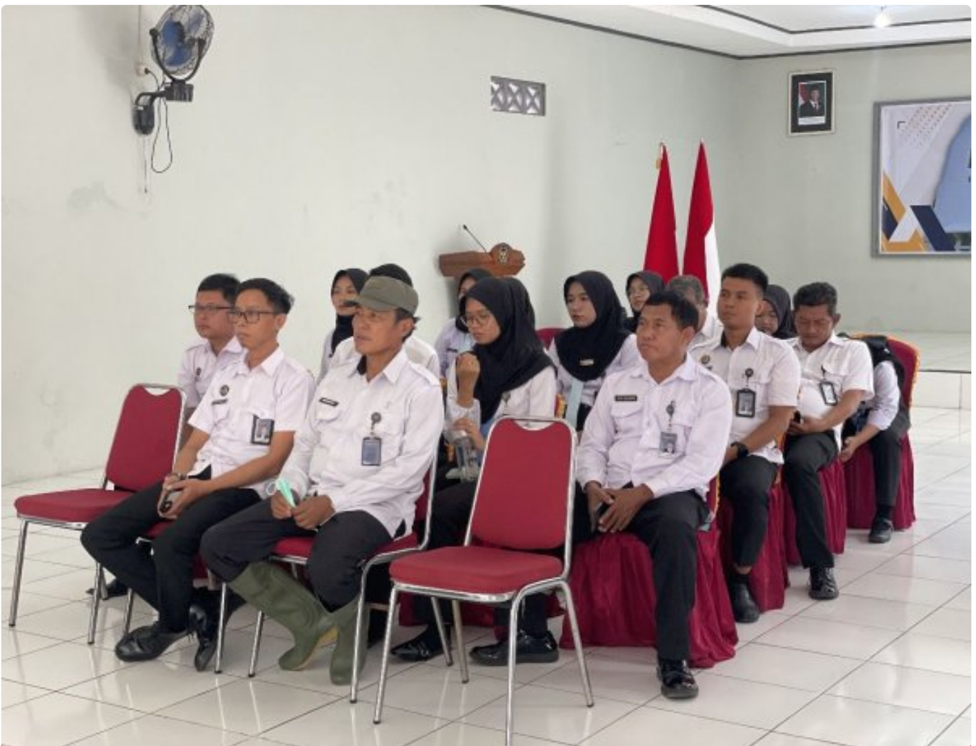
Lapas Pekalongan Ikuti Rakor Pengendalian Capaian Kinerja Semester II dan Refleksi Akhir Tahun 2025

Pekalongan – Lembaga Pemasyarakatan (Lapas) Kelas IIA Pekalongan mengikuti kegiatan Rapat Koordinasi (Rakor) Pengendalian Capaian Kinerja Semester II dan Refleksi Akhir Tahun 2025 yang diselenggarakan secara virtual melalui aplikasi Zoom, pada Senin pagi (15/12/2025).