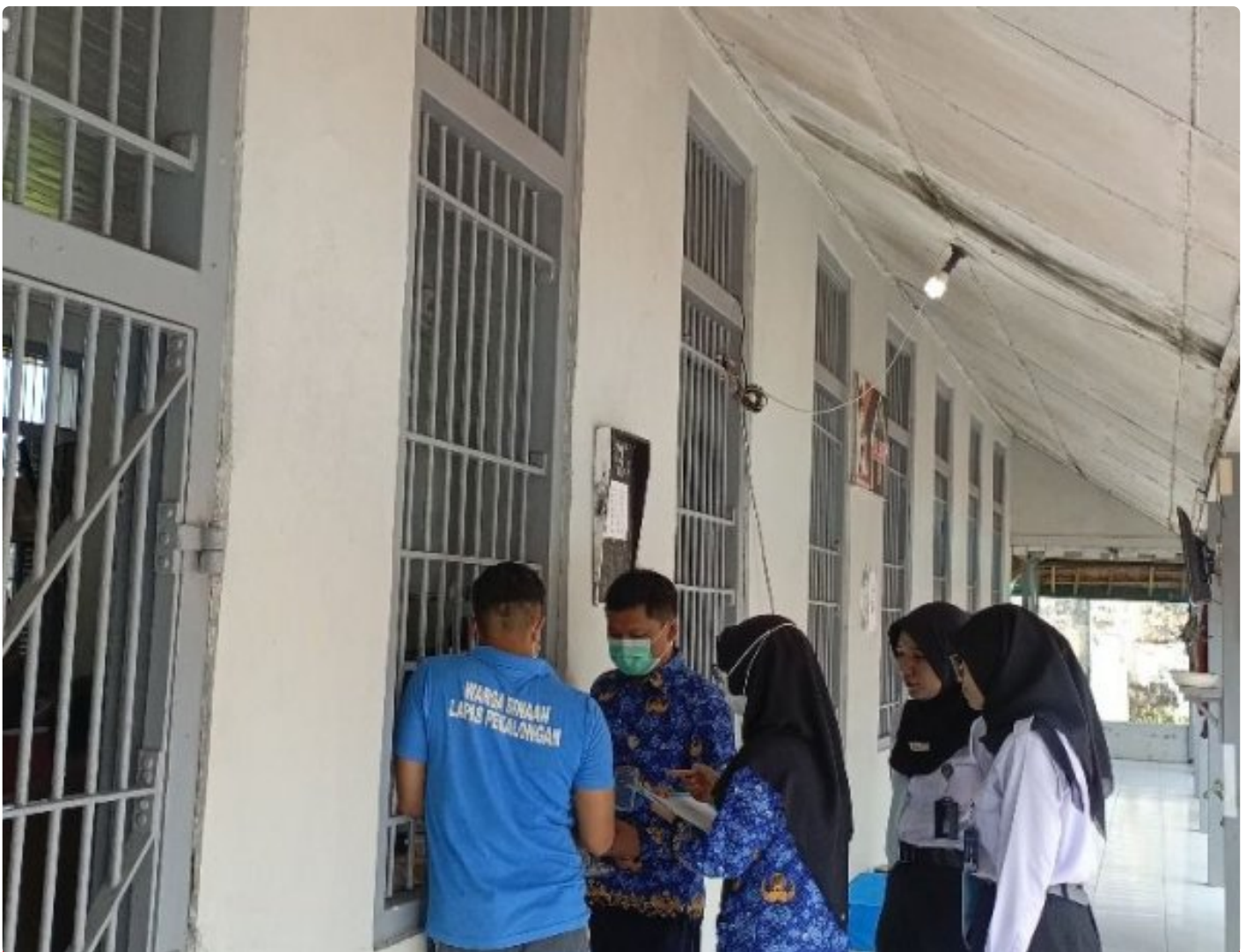
Lapas Pekalongan Laksanakan Pembagian Obat TPT sebagai Upaya Pencegahan Tuberkulosis

Kota Pekalongan - Lembaga Pemasyarakatan (Lapas) Kelas IIA Pekalongan melaksanakan kegiatan pembagian obat Terapi Pencegahan Tuberkulosis (TPT) kepada Warga Binaan Pemasyarakatan (WBP), Rabu (17/12).